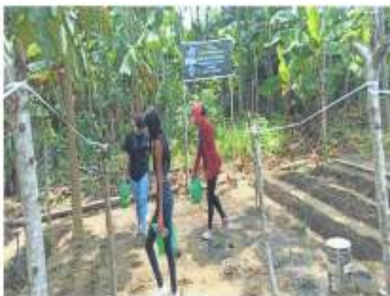
IMAGEN 17. PROYECTO DE IMPLEMENTACIÓN Y REHABILITACIÓN DE HUERTOS

Este proyecto permitió la implementación de nuevos huertos en diferentes lugares de nuestra parroquia y a su vez también logro recuperar huertos que no estaban siendo utilizados, la implementación y recuperación de huertos permitirá que los moradores de estos sectores a preñar a producir sus propio alimentos y plantas medicinales.