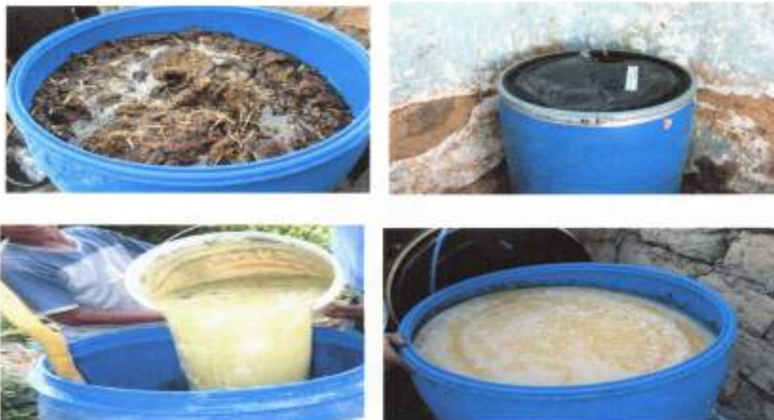
IMAGEN 10. PROYECTO "GADP-BIOL"

Se inició la fase 1 la cual consiste en la elaboración de un biofertilizante, el mismo que será de gran ayuda para que nuestros productores alcancen una mayor producción, con este proyecto se busca producir más de 200 galones de biofertilizante para beneficiar a más de 50 productores.