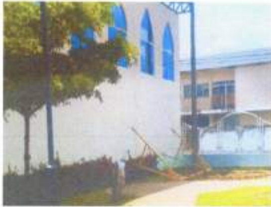
IMAGEN 6. REPOTENCIACIÓN DE JUEGOS DE PARQUE INFANTIL.

Con los trabajos de repotenciación del parque infantil se dio una mejor imagen a nuestra parroquia y un mejor lugar de entretenimientos para nuestros niños.