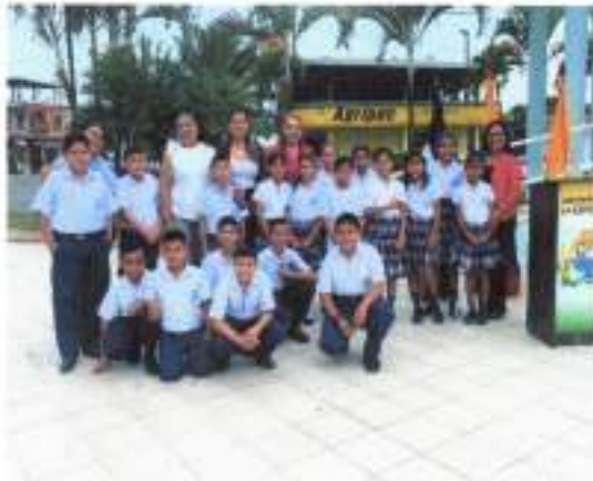
IMAGEN 7. PROYECTO CULTURAL "AGOSTO MES DE ARTE Y CULTURA"

A través de este proyecto se buscó fomentar la parte cultural y artística de nuestra parroquia mediante la realización de varias actividades, el valor de este proyecto fue de $ 2.500 dólares.