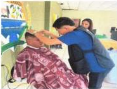
IMAGEN 11. GESTIONES REALIZADAS CON PREFECTURA