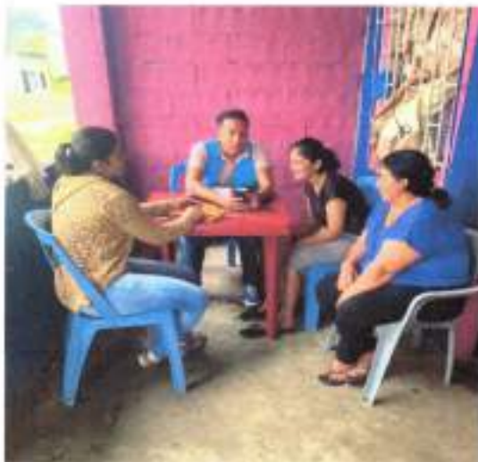
IMAGEN 2. PROYECTO DE DISCAPACIDAD

De acuerdo con la asignación presupuestaria cumplimos con el aporte destinado a los grupos prioritarios enfocados en el bienestar y desarrollo del vulnerable. para fortalecer la atención y las necesidades de las familias en el hogar y la comunidad de 18 a 64 años, que incluye acciones de salud preventiva, educación atención de motricidad fina y gruesa. cabe indicar que el monto total es de 13.360,53. el aporte GAD es de 1.632,89 y el aporte MIES es de 11.727,64.