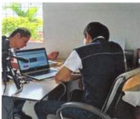
IMAGEN 14. GESTIÓN CON CONAGOPARE LOS RÍOS