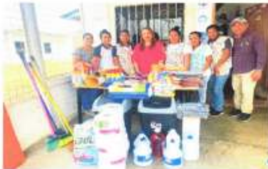
IMAGEN 1. PROYECTO CDI MANITAS TRAVIESAS

El GAD Parroquial Rural La Esperanza se enfoca en el bienestar y desarrollo de los niños vulnerables, mediante procesos educativos de calidad, manteniendo convenio con el Ministerio de Inclusión Económica y Social MIES para fortalecer la atención y las necesidades de las familias. Indicar que el monto total es de 116.198,37, el aporte GAD es de 15.121,51 y el aporte mies es de 101.076,86.