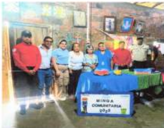
IMAGEN 3. PROYECTO ADULTO MAYOR.

De acuerdo a la asignación presupuestaria cumplimos con el aporte destinado a los grupos prioritarios por lo que se estructura anualmente un sistema de actividades físico recreativo personalizado favoreciendo al mantenimiento activo de las capacidades físicas, psíquicas y matrices atenuado al deterioro a la vejez, propiciando un espacio apto y dotado de implementos necesarias para el desarrollo de actividades previamente planificados por el promotor encargado. Cabe indicar que el monto total es de 15874.41, el aporte GAD es de 479,01 y el aporte mies es de 15.395,40.