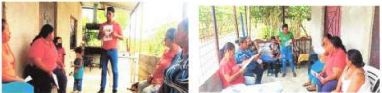
IMAGEN 9. PROYECTO "CRIANZA, MANEJO Y PRODUCCIÓN DE ESPECIES MENORES – CODORNICES".

Se realizó la primera fase de socialización y capacitación para la crianza, manejo y producción de especies menores, los sectores beneficiados son el Recinto Atascoso y Ana María.