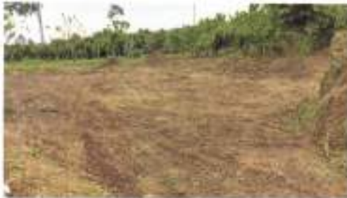
IMAGEN 4. LIMPIEZA CON GALLINETA Y FUMIGACIÓN

Se realizo trabajos de mantenimientos en el cementerio general de la esperanza dentro de este rubro se realizaron trabajos de pintura, trabajos de fumigación limpieza con gallinetas, a través de estos trabajos se busca dar una mejor imagen del Cementerio.