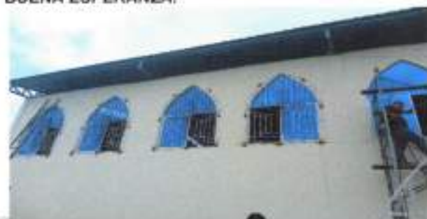
IMAGEN 16. PROYECTO DE MANTENIMIENTO DE VENTANAS DE LA IGLESIA VIRGEN DE LA BUENA ESPERANZA.

Este proyecto permitió mejorar el ornato de nuestra iglesia para que nuestros ciudadanos puedan recibir las misas en un ambiente más cómodo.