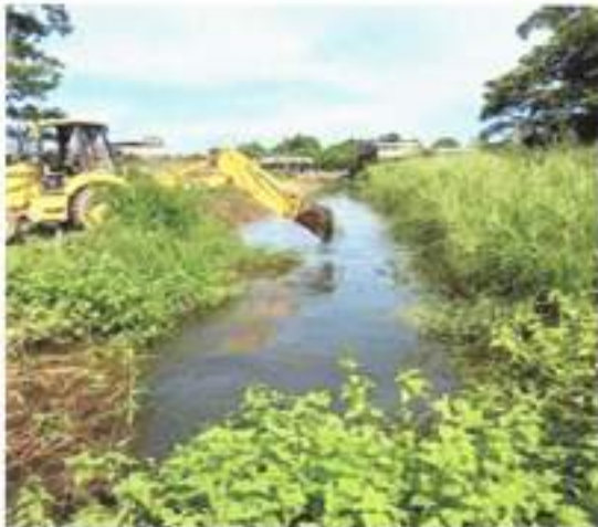
IMAGEN 12. GESTIÓN CON LA ALCALDÍA