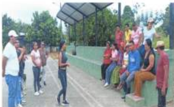
IMAGEN 15. CAPACITACIÓN SOBRE AVICULTURA EN EL RECINTO LA ITALIA.

Con este Proyecto se busca incentivar a los moradores de este sector a iniciar la producción de crianza de pollos broile, para que este emprendimiento les permita mejorar su situación económica.