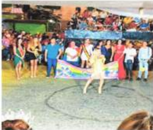
IMAGEN 8. FESTIVAL DE ARTES ESCÉNICAS LA ESPERANZA 2023

Mediante este proyecto se buscó impulsar costumbres y tradiciones de la nuestra parroquia, a través de las diferentes actividades que se realizaron en el mes de diciembre, el monto de este proyecto es de $ 10.000.