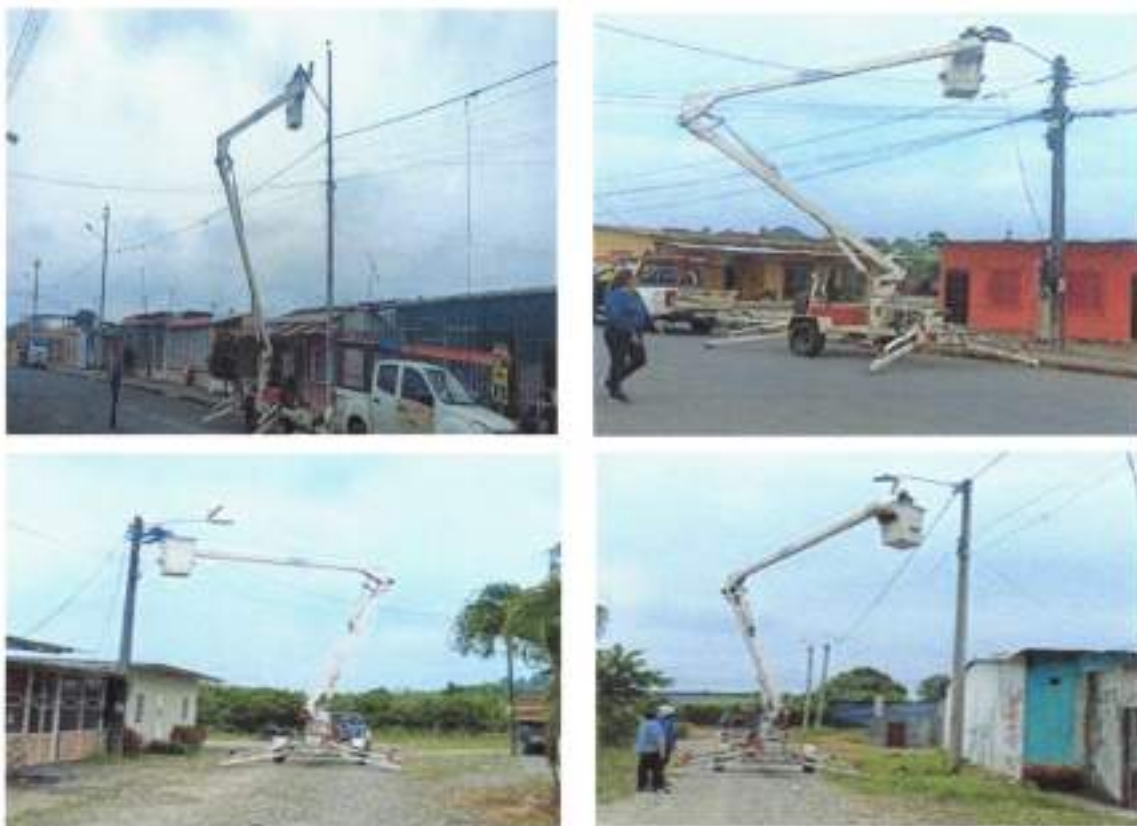
IMAGEN 13. GESTIONES REALIZADAS CON CNELE. P